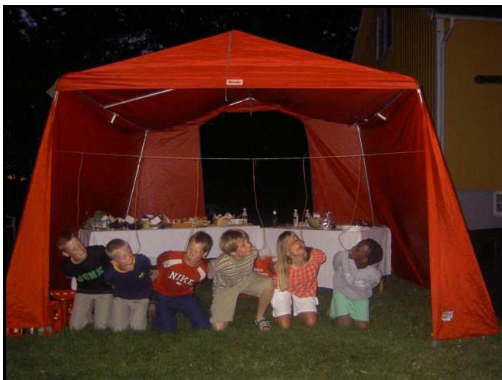
Barnen äter godis som aldrig förr!