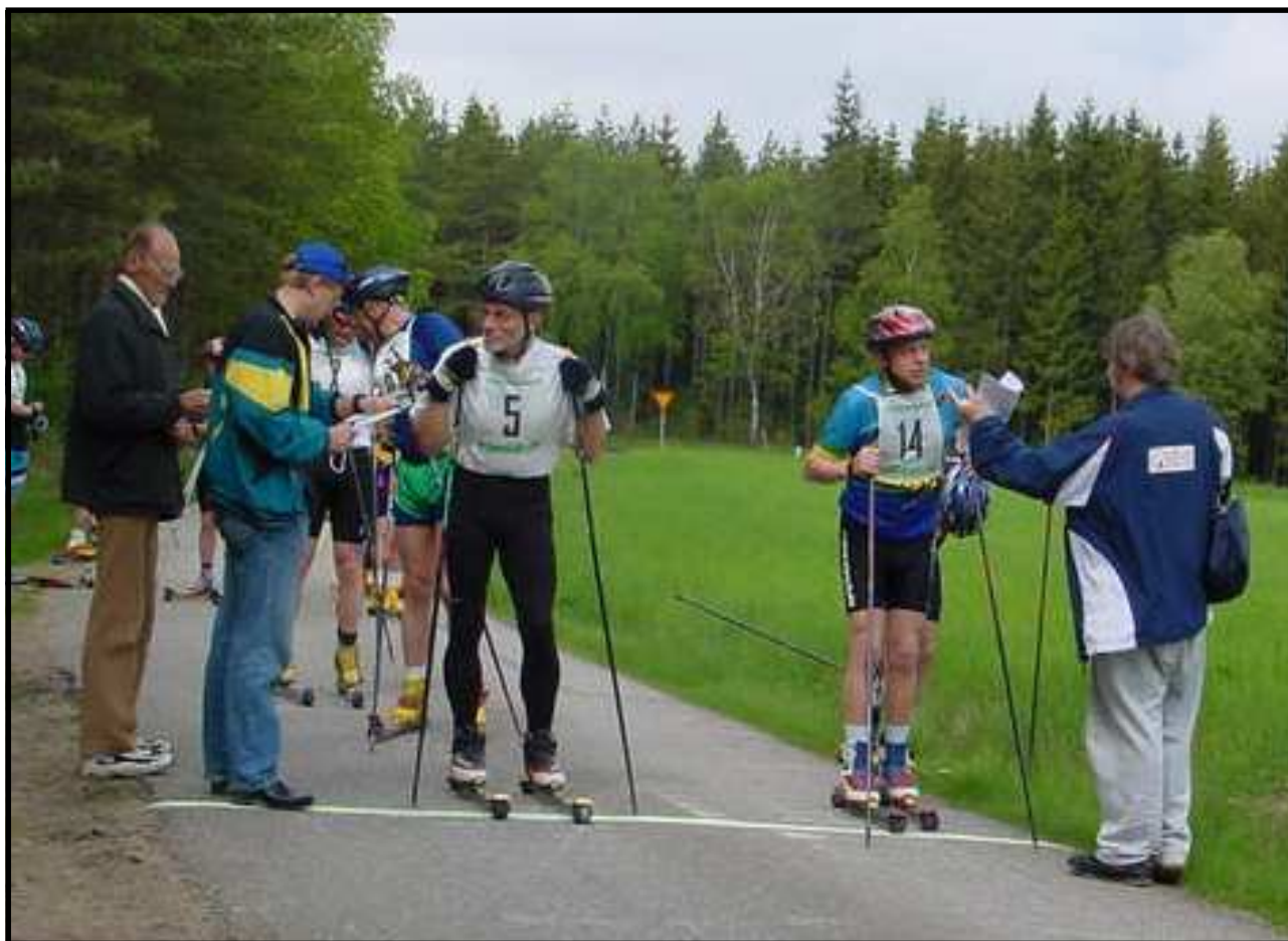
Bilden visar Karlsnäsrullen .

Nja inte riktigt än! Våra skidåkare klarar sig galant med hjul istället!