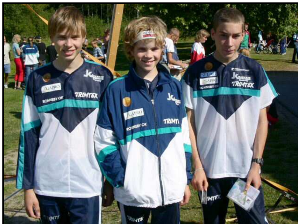
Ungdomsframgångar på DM!