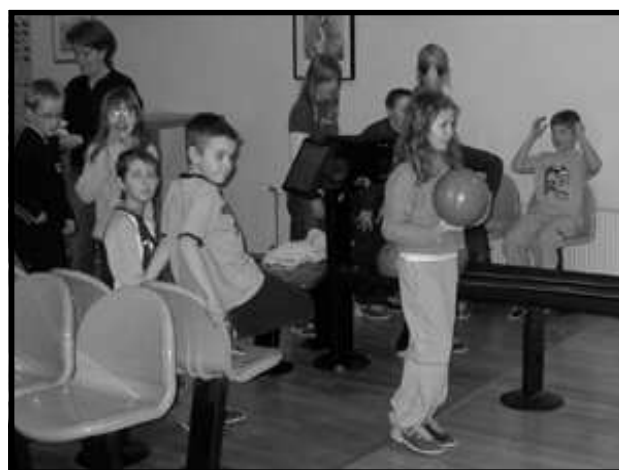
Barnen trivdes också.