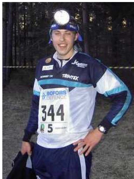
Jag ser rätt nöjd ut efter målgång.

men målet för mig var bara att komma i mål, så jag var trots allt väldigt nöjd med insatsen.