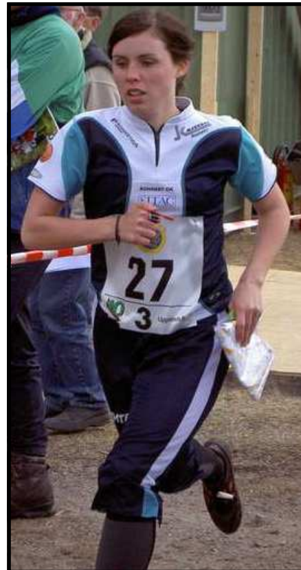
Även Teres gjorde ett mycket bra lopp.