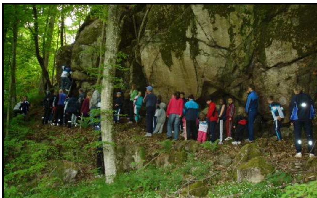
Barnen väntar ivrigt på att få bestiga berget.